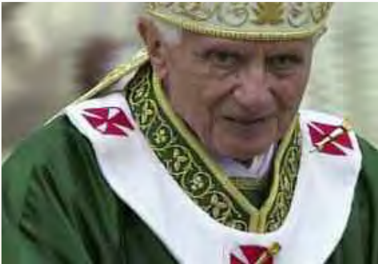
Il 25 febbraio 2013, Benedetto XVI ricevette una condanna a 25 anni di prigione per crimini contro l'umanità.