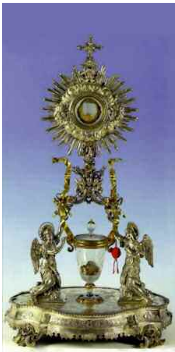
Miracolo di Lanciano. L’ostensorio d’argento contenente l’Ostia e il vino che sono realmente carne e sangue.

Il “segno” di Bolsena è passato alla storia come uno dei miracoli eucaristici che puntellano da millecento anni l’Italia.