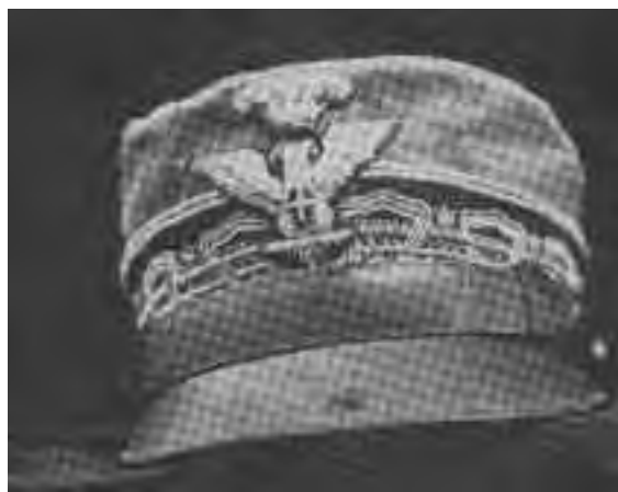
Il copricapo del generale Cantore con il foro della pallottola mortale.