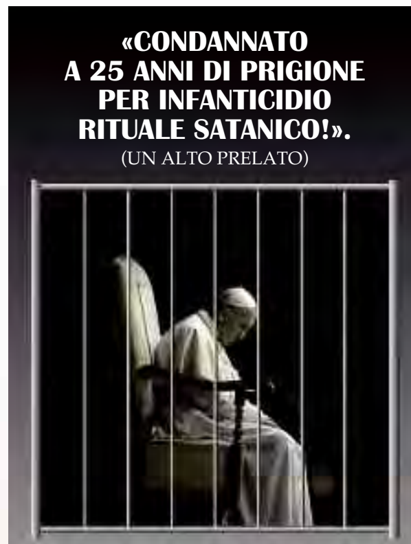
Il 25 febbraio 2013, Benedetto XVI ricevette una condanna a 25 anni di prigione, per crimini contro l'umanità. Il 18 luglio 2014, Jorge Bergoglio fu condannato a 25 anni di prigione, per crimini contro l'umanità, assassinio e traffico di esseri umani.

Dal sito del Tribunale Internazionale per i Crimini della Chiesa e dello Stato ( www.itccs.org ), con sede centrale a Bruxelles, a proposito del genocidio di oltre 50.000 bambini in Canada, USA, Argentina, Europa , come vittime sospette di un Culto Internazionale di sacrifici di bambini che ha il nome di “Nono Cerchio” , si legge: