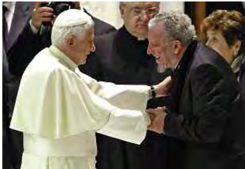
Benedetto XVI e Kiko.

«... si tratta 373 pagine e non di semplici “fogli” come si esprimo l’Ill.mo Porporato! Sono gli Orientamenti alle équipes di catechisti per la fase di conversione , pubblicazione a cura del Centro Neo-catecumenale “Servo di